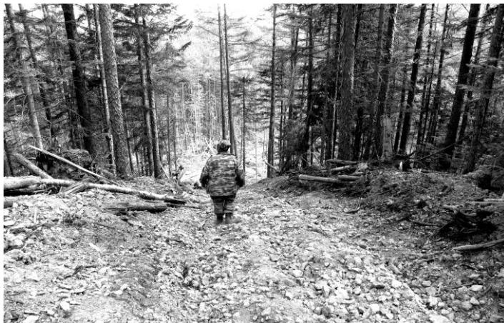
Рис. 2. Эрозия почв в верховьях р. Максимовки (Приморский край), обусловленная трелевкой древесины. 2005 г.

Влияние на животный мир обусловлено сложностью связей в экосистемах, когда небольшие изменения могут привести к непредвиденным последствиям. Например, так называемые ключевые виды растений играют особую, иногда не совсем понятную роль в экосистемах. Вырубка таких деревьев нередко приводит к катастрофическим последствиям для фауны [6]. Также в период лесозаготовок увеличиваются охота и рыболовство, в том числе браконьерскими способами.