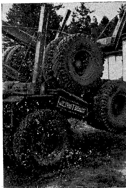
Рис. 1. Прицеп-ропуск ГКБ-9383, погруженный на раму лесовозного автопоезда МАЗ-509А

системы при переезде единичных неровностей и движении по гравийным и грунтовым дорогам. Оценивали плавность хода автопоезда в системе тягач — погруженный ропуск и напряженно-деформированное состояние несущей конструкции тягача при переезде единичных неровностей [1, 2].