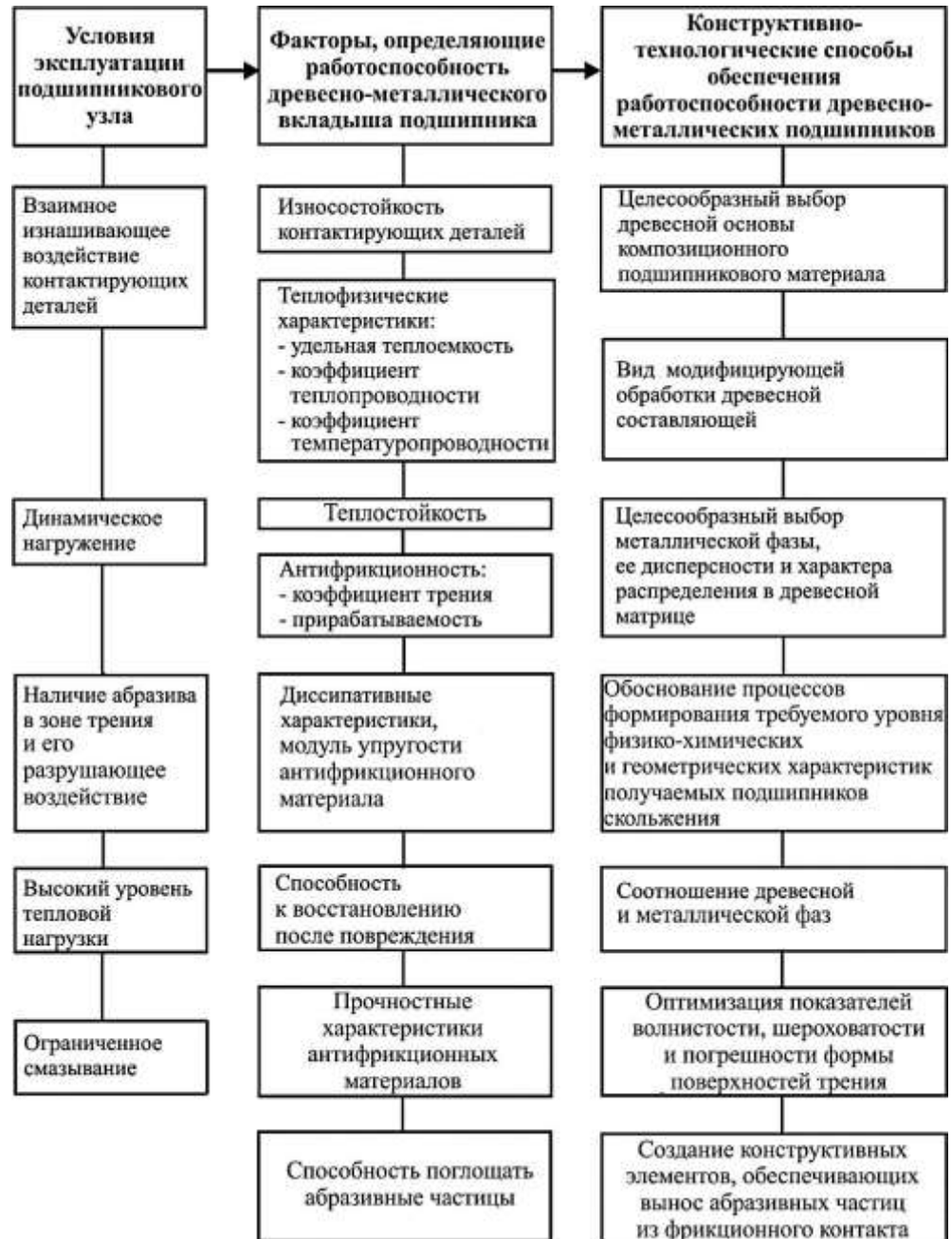
Рис. 1. Система взаимосвязи функциональных характеристик древесно-металлических подшипников скольжения и способы их достижения при проектировании и изготовлении